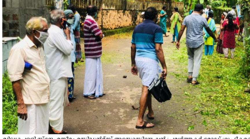
വിലപ്പാലുള്ളി സ്നേഹനിരം സിപിഡൻ്റ്സ് അസോസിയേഷൻ പ്രവർത്തകർ റോഡ് ശുചീകരണം നടത്തുന്നു.