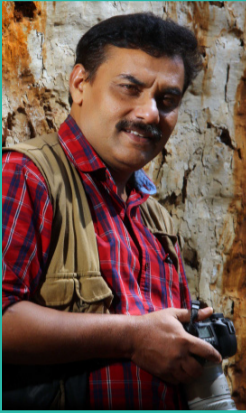
ഫോട്ടോഗ്രാഫർ അജീബ് കൊമാച്ചി പകർത്തിയ കറുപ്പി ചിത്രങ്ങൾ കേരളപ്രണാമം വായനക്കാർക്കായി പങ്കുവയ്ക്കുകയാണ്... കൂടുതൽ ചിത്രങ്ങൾക്ക് പേജ് ആർ കാണുക.

നഗ്നനേത്രങ്ങൾകൊണ്ട് കാണാനാവാത്ത ഒരു വൈരസിന് മുന്നിൽ പകച്ചുനിൽക്കുമ്പോഴും മനുഷ്യർ പഠിക്കുന്നില്ല... കറുപ്പിനെ, വെള്ളത്തിനെ, പ്രകൃതിയെ, സഹജീവികളെ.... ഇങ്ങനെ എല്ലാറ്റിനേയും നശിപ്പിച്ചുകൊണ്ടുള്ള കൃതിച്ചുപായൽ തുടരുക തന്നെയാണ്... പാലക്കാട് ഗർഭിണിയായ കാട്ടാനയുടെ ദുരന്തം ഇന്ന് നാം ചർച്ച ചെയ്യുന്നു. പക്ഷേ, നമ്മൾ അറിയത്തക്കവണ്ണം, ചർച്ച ചെയ്യപ്പെടാതെ പോകുന്ന ഒരുപാടൊരുപാട് കൊടും പാതകങ്ങൾ... കൊടും പീഡനങ്ങൾ... ഈ ഭൂമി മനുഷ്യന്റേതല്ല മാത്രമല്ലെന്ന് ഇവരുടെ തുടർച്ചയായെന്നും എന്താണ് നമ്മൾ മനസ്സിലാക്കുക? പ്രശസ്ത പ്രൊഫഷണൽ ഫോട്ടോഗ്രാഫർ അജീബ് കൊമാച്ചി പകർത്തിയ കറുപ്പി ചിത്രങ്ങൾ കേരളപ്രണാമം വായനക്കാർക്കായി പങ്കുവയ്ക്കുകയാണ്... കൂടുതൽ ചിത്രങ്ങൾക്ക് പേജ് ആർ കാണുക.