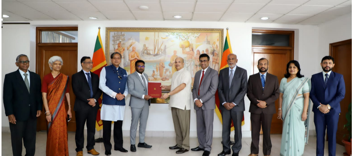
കെ.കെ. ആർ ഗ്രൂപ്പ് കമ്പനിയുടെ മാനേജിംഗ് ഡയറക്ടറെ ശ്രീലങ്കൻ കോൺസുലേറ്റ് ജനറൽ ആദരിച്ച ചടങ്ങിൽ നിന്ന്

ഇവിടെ എത്തുന്നത് മുതൽ അടുത്ത 14 ദിവസം സ്വയം നിരീക്ഷണത്തിൽ കഴിയണം. കോവിഡ് അനുബന്ധ രോഗലക്ഷണങ്ങൾ കണ്ടാൽ ഉടൻ പ്രദേശത്തെ ആരോഗ്യ പ്രവർത്തകരെ അറിയിക്കുകയും തുടർ നടപടികൾ സ്വീകരിക്കുകയും വേണം. മാർഗനിർദ്ദേശങ്ങൾ ലംഘിക്കുന്നവർക്കെതിരെ ദുരന്ത നിവാരണ - പൊതുജനാരോഗ്യ സംരക്ഷണ നിയമപ്രകാരം നടപടി സ്വീകരിക്കാൻ ഹൈ റിസ്ക് പട്ടികയിൽ പെടാത്ത രാജ്യങ്ങളിൽ നിന്ന് എത്തുന്നവരിലും ഒമിക്രോൺ ബാധ സ്ഥിരീകരിക്കുന്ന സാഹചര്യത്തിൽ വിദേശത്ത് നിന്നും എത്തുന്ന എല്ലാവർക്കും നിർബന്ധിത കാറൻ്റീൻ നിർദ്ദേശനൽകിക്കൊണ്ടുള്ള അറിയിപ്പ് എറണാകുളം, കോട്ടയം ജില്ലാ കളക്ടർമാർ പുറത്തിറക്കി. വിദേശത്ത് നിന്ന് എത്തുന്നവർ 14 ദിവസം സ്വയം നിരീക്ഷണത്തിൽ കഴിയണമെന്നാണ് അറിയിച്ചത്. കാറൻ്റീൻ കാലയളവിൽ പൊതുസ്ഥലങ്ങൾ സന്ദർശിക്കുന്നതും പടങ്ങുകളിൽ പങ്കെടുക്കുന്നതും ഒഴിവാക്കണം.