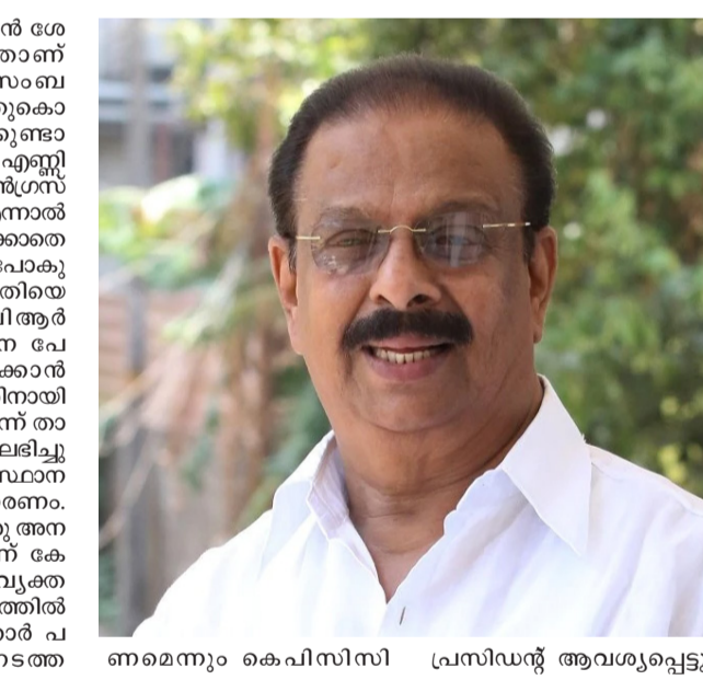
നമസ്കരം കെ.പിസിസി പ്രസിഡന്റ് ആവശ്യപ്പെട്ടു.

ആർ വെച്ച് സമൂഹത്തെ ബോധ്യപ്പെടുത്തണം. അതിന്റെ പാരിസ്ഥിതിക ആഘാതവും സാങ്കേതിക ആഘാതങ്ങളെ സംബന്ധിച്ചും പഠനങ്ങൾ വേണം. അതിനടിസ്ഥാനപ്പെടുത്തി പദ്ധതിയുടെ നേട്ടങ്ങളും കോട്ടങ്ങളും പൊതുസമൂഹത്തോടു മറ്റും ബോധ്യപ്പെടുത്തുകയാണ് വേണ്ടത്. അങ്ങനെ ആദ്യഘട്ടം മനസിൽ ആശങ്കയില്ലാതെ പദ്ധതി നടപ്പാക്കണമെന്നേ പറഞ്ഞിട്ടുള്ളൂവെന്ന് അദ്ദേഹം കുട്ടിച്ചേർത്തു. ഇതിൽ ആശങ്കയുണ്ടാകാതെ എൽഡിഎഫ് സർക്കാരിന്റെ എടുത്തു ചാട്ടമാണ്. എന്തിനാണ് ഇത്ര ധൂതിയെന്ന ചോദ്യത്തിൽ ഇതുവരെ ഉത്തരം പറഞ്ഞിട്ടില്ല. കേരളം പോലൊരു കൊച്ചി സംസ്ഥാനത്തിന് ഇത്രയും വലിയൊരു സാമ്പത്തിക