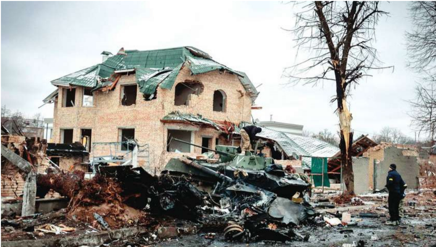
കീവീനൂ സമീപമുള്ള ബുച്ചി നഗരത്തിൽ തകർന്ന റഷ്യൻ സൈനികവാഹനങ്ങളുടെയും കെട്ടിടങ്ങളുടെയും അവശിഷ്ടങ്ങൾ പരിശോധിക്കുന്നവർ