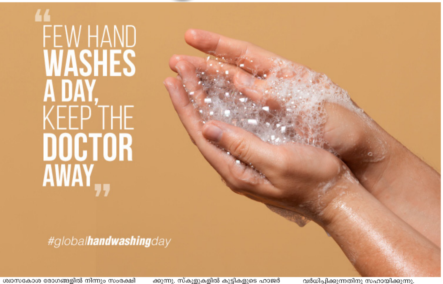
ശ്വാസകോശ രോഗങ്ങളിൽ നിന്നും സംരക്ഷിക്കുന്നു. സ്കൂളുകളിൽ കുട്ടികളുടെ ഹാജർ വർദ്ധിപ്പിക്കുന്നതിനു സഹായിക്കുന്നു.

ഉപയോഗിച്ചു കഴുകി വൃത്തിയാക്കുന്നതിലൂടെ പലരോഗങ്ങളും പ്രതിരോധിക്കാൻ സാധിക്കും. സാൽമോണല്ല, ഇ കോളി, നോറോ വൈറസ് എന്നിവയുടെ പ്രധാന സ്രോതസ്സാണ് മനുഷ്യരുടെയും മൃഗങ്ങളുടെയും വിസർജ്യം. വിസർജ്യത്തിലുള്ള ഈ അണുക്കൾ കൈകൾ വഴി മനുഷ്യ ശരീരത്തിൽ എത്തി വയറിളക്കം ശ്വാസകോശരോഗങ്ങൾ എന്നിവയ്ക്ക് പുറമെ ഹാൻഡ്-ഫുട്ട്-മുതൽ ഡിസീസ് പോലുള്ള രോഗങ്ങളും ഉണ്ടാക്കുന്നതിനു കാരണമാകുന്നു. ശുചിമൂറി ഉപയോഗിച്ചശേഷം, ഡയപ്പർ മാറ്റിയതിനുശേഷം പച്ച മാംസം കൈകാര്യം ചെയ്തതിനു ശേഷം കൈകൾ വൃത്തിയാക്കുന്നതിനാണ് ഇത്തരം രോഗാണുക്കൾ കൈകളിൽനിന്നും മനുഷ്യരുടെ ഉള്ളിൽ എത്താം. ആളുകൾ ചുമയ്ക്കുമ്പോഴും തുമ്പുമ്പോഴും മൂക്കും വായും പൊത്തിപ്പിടിക്കാത്തതു മൂലം രോഗാണുക്കൾ പ്രവേശിച്ചു ഏതെങ്കിലും വസ്തുക്കളിൽ മറ്റാർക്കെങ്കിലും തൊടുക വഴിയും രോഗാണുക്കൾ മനുഷ്യശരീരത്തിൽ എത്താം. ഗോവണിയുടെ യുടെ കൈവരികൾ, മേശ, കസേര, കളിപ്പാട്ടങ്ങൾ, കമ്പ്യൂട്ടറുകൾ, വാതിലിന്റെ പിടി, താക്കോൽ മുതലായവ വഴി രോഗാണുക്കൾ പകരുന്നതിനുള്ള സാധ്യത കൂടുതലാണ്. കണ്ണുകൾ, മുക്ക്, വായ് എന്നിവിടങ്ങളിൽ സ്പർശിച്ചു കൊണ്ടിരിക്കുന്ന ശീലം പലർക്കുമുണ്ട്. ഇവ വഴിയും രോഗാണുക്കൾ ഉള്ളിലെത്താം. വൃത്തിയാക്കാതെ ഭക്ഷണം പാകം ചെയ്യുകയോ കഴിക്കുകയോ ചെയ്യുന്നതു മൂലം രോഗാണുക്കൾ ഭക്ഷണത്തിൽ എത്തുകയും ആളുകളെ രോഗികൾ ആക്കുകയും ചെയ്യും. ലോകത്ത് ഏകദേശം 1.8 മില്യൺ കുട്ടികൾ വയറിളക്കവും ന്യൂമോണിയയും മൂലം മരിക്കുന്നു. കൈകൾ ശുചിയായാക്കുന്നത് മൂന്നിലൊന്നു കുട്ടികളെ വയറിളക്കത്തിൽ നിന്നും അഞ്ചിലൊന്നു കുട്ടികളെ ന്യൂമോണിയ പോലുള്ള