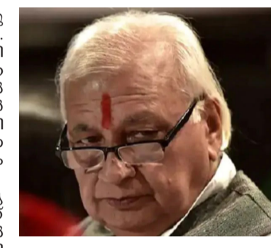
വി.സി. ഇതോടെയാണ് അസാധാരണ നടപടിയുമായി ഗവർണ്ണർ രംഗത്തെ

നടപടിക്രമങ്ങൾ പാലിച്ചില്ലെന്നായിരുന്നു കത്തിൽ ചൂണ്ടിക്കാട്ടിയിരുന്നത്. ഇതിന് പുറമെ ഗവർണ്ണർ പുറത്താക്കിയവർക്ക് നവംബർ നാലിന് നടക്കുന്ന സ്പെഷ്യൽ സെന്റ് യോഗത്തിൽ പങ്കെടുക്കാനുള്ള കത്ത് അയച്ചു സർവകലാശാല മുന്നോട്ടുപോകുന്നതിനിടെയാണ് 15 അംഗങ്ങളേയും പുറത്താക്കി ഗവർണ്ണർ തന്നെ വിജ്ഞാപനം ഇറക്കിയിരിക്കുന്നത്. ഉടനടി പുറത്താക്കണമെന്ന് ആവശ്യപ്പെട്ട് ശനിയാഴ്ചയാണ് വി.സി.ക്ക് ഗവർണ്ണർ കത്ത് നൽകിയത്. എന്നാൽ ശിക്ഷാനടപടി വിജ്ഞാപനം ചെയ്തിരുന്നില്ല. ഇതിനിടെ വി.സി ഉത്തരവ് നടപ്പാക്കാതെ ശബരിമലയ്ക്കു പേ