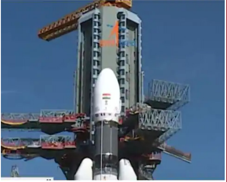
ജിഎസ്എൽവി മാർക്ക് 3 ഇസ്രോ ആദ്യമായി ഒരു വാണിജ്യ വിക്ഷേപണത്തിന് ഉപയോഗിക്കുകയാണ്.

പഥത്തിൽ എത്തിക്കാനാണ് വൺ വെബ് ലക്ഷ്യമിടുന്നത്. ഇതിൽ 428 എണ്ണം ഇതിനകം വിക്ഷേപിച്ചുകഴിഞ്ഞു. റഷ്യയുടെ റോസ് കോസ്മോസിൻറെ സേവനമാണ് ഇതുവരെ അവർ ഉപയോഗിച്ചിരുന്നത്. യുക്രൈൻ യുദ്ധത്തിൻറെ പശ്ചാത്തലത്തിൽ റഷ്യയും ഇതര യൂറോപ്യൻ രാജ്യങ്ങളുമായുള്ള ബന്ധം ഉലഞ്ഞതോടെയാണ് വെബ് വൺ ഐഎസ്ആർഒയുടെ വാണിജ്യ വിഭാഗമായ ന്യൂ സ്പേസ് ഇന്ത്യയുമായി കരാറുണ്ടാക്കിയത്. വിക്ഷേപണം വിജയമായാൽ ആഗോള വാണിജ്യ വിക്ഷേപണ രംഗത്ത് ഇന്ത്യക്കിടവൻ കുതിച്ചുചാട്ടമാകും.