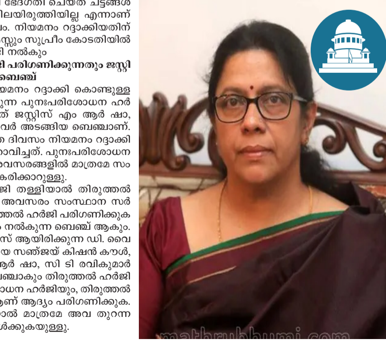
കേരളം പുനഃപരിശോധന ഹർജി നൽകും