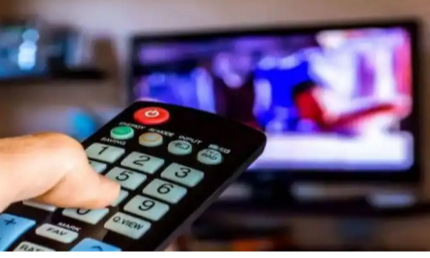
മന്ത്രാലയങ്ങൾക്ക് ഇനി ബ്രോഡ്കാസ്റ്റിംഗ് മേഖലയിലേക്ക് കടക്കാൻ അനുവദിക്കില്ലെന്നും നിലവിലുള്ള ചാനൽ പ്രക്ഷേപണം പ്രസാർ ഭാരത്തി വഴിയായാക്കണമെന്നും നിർദ്ദേശമുണ്ട്.

വികേന്ദ്ര സിന്ദിക്കം നടപടി ശാസ്ത്രീയ സർക്കാരിനുള്ള ഇനി മുതൽ നേരിട്ട് ടെലിവിഷൻ ചാനൽ നടത്തരുതെന്ന് വാർത്താ വിതരണ പ്രക്ഷേപണ മന്ത്രാലയത്തിന്റെ നിർദ്ദേശം. നിലവിലുള്ള ചാനൽ പ്രക്ഷേപണം പ്രസാർ ഭാരത്തി വഴിയായാക്കണമെന്നാണ് വാർത്താ വിതരണ പ്രക്ഷേപണ മന്ത്രാലയം പുറത്തിറക്കിയ പുതിയ മാർഗനിർദ്ദേശത്തിലുള്ളത്. 2023 ഡിസംബറോടെ പൂർണ്ണമായും സംസ്ഥാനങ്ങൾ ചാനൽ പ്രക്ഷേപണത്തിൽ നിന്നും പിന്മാറണമെന്നും വാർത്താ വിതരണ മന്ത്രാലയം നിർദ്ദേശിച്ചു. കേരളത്തിലെ വിദ്യാഭ്യാസ ചാനലായ