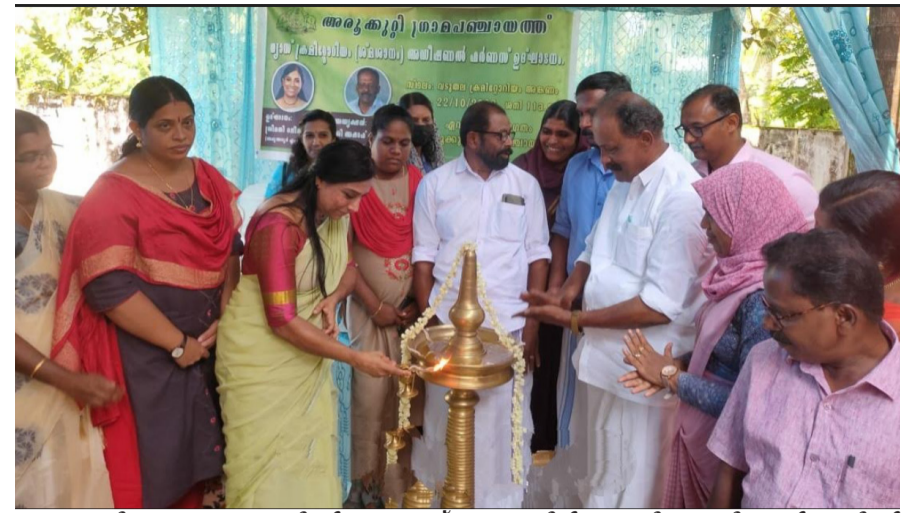
അരുക്കുറ്റി ഗ്രാമപഞ്ചായത്തിന്റെ വാതക ശ്മശാനത്തിൽ സ്ഥാപിച്ച അധിക ഹർണസിലെ ഉദ്ഘാടനം ദേശീയ ജോലി എം.എൽ.എ. നിർവഹിക്കുന്നു.