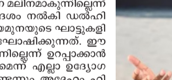
ക്രമീകരണത്തിനുമായി ഡൽഹി പോലീസ്, ഡൽഹി ജല ബോർഡ് എന്നിവയുടെ സഹായം വകുപ്പുകളുമായി സഹകരിക്കും. തിരക്ക് ഒഴിവാക്കാൻ എം.സി.ഡി. പാർക്കിംഗ് നിലവിലും അനുവദിക്കുമെന്നും അധികൃതർ അറിയിച്ചു. നഗരത്തിലുടനീളം 1100 സ്ഥലങ്ങളിൽ സർക്കാർ വിപുലമായ ഒരുക്കങ്ങൾ നടത്തിയിട്ടുണ്ട്. ശുചീകരണങ്ങൾ, ആംബുലൻസുകൾ, പ്രഥമശുശ്രൂഷ, വൈദ്യുതി തുടങ്ങിയ തയ്യാറെടുപ്പുകൾ സർക്കാർ നടത്തിയിട്ടുണ്ട്. സുരക്ഷാകാര്യങ്ങളിൽ ഡൽഹി പോലീസ് ജാഗ്രതപൂർവ്വം വിവിധ സ്ഥലങ്ങളിൽ സി.സി.ടി.വി. ക്യാമറകൾ സ്ഥാപിക്കും. ഇതിനുമുമ്പായി 25 കോടി രൂപയാണ് സർക്കാർ മാറ്റിവെച്ചിട്ടുള്ളത്. ഒക്ടോബർ 30, 31 തീയതികളിൽ മറ്റ് ആഘോഷിക്കും. സിറ്റികൾ മുട്ടോളം വെള്ളത്തിൽ ഉപവെച്ചിട്ടുള്ള സുരഭദ്രവനെ പ്രാർഥിക്കുന്നത് പൂജയുടെ പ്രധാന ചടങ്ങാണ്. ഡൽഹിയിൽ താമസിക്കുന്ന ബിഹാറിലെയും കിഴക്കൻ ഉത്തർപ്രദേശിലെയും ആളുകൾ പൂർവ്വബലികൾക്കിടയിൽ ഈ ഉത്സവം വളരെ ജനപ്രിയമാണ്.

ന്യൂഡൽഹി: മറ്റ് പൂജ സമയത്ത് യമുന മലിനമാകുന്നില്ലെന്ന് ഉറപ്പാക്കാൻ ഉദ്യോഗസ്ഥർക്ക് നിർദ്ദേശം നൽകി ഡൽഹി മുഖ്യമന്ത്രി അരവിന്ദ് കെജ്റിവാൾ. യമുനയുടെ ഘോഷുകളിലാണ് പ്രധാനമായും മറ്റ് പൂജ ആഘോഷിക്കുന്നത്. ഈ അവസരത്തിൽ യമുന മലിനമാകുന്നില്ലെന്ന് ഉറപ്പാക്കാൻ എല്ലാ ക്രമീകരണങ്ങളും ഒരുക്കണമെന്ന് എല്ലാ ഉദ്യോഗസ്ഥർക്കും നിർദ്ദേശം നൽകിയിട്ടുണ്ടെന്നും അദ്ദേഹം ഹിന്ദിയിൽ ടീറ്റർ ചെയ്തു. ഘോഷുകളിലെ തെറ്റായ വിളക്കുകൾ വർദ്ധിച്ചാൽ ഒരു വാർഡിന് 40,000 രൂപ അനുവദിച്ചതായി ഡൽഹി മുനിസിപ്പൽ കോർപ്പറേഷൻ (എം.സി.ഡി.) വെള്ളിയാഴ്ച പ്രസ്താവത്തിൽ അറിയിച്ചു. ഒരു വാർഡിന് രണ്ട് ഘോഷുകൾ വീതമാണ് തുക അനുവദിക്കുക. തലസ്ഥാനത്തെ എല്ലാ മറ്റ് ഘോഷുകളിലും ശുചീകരണ സേവനങ്ങൾ ഈ സംഘങ്ങൾ മുഖേന ലഭ്യമാക്കും. ഡൽഹി അർബൻ ഷെൽട്ടർ ഇൻഫ്രാസ്ട്രക്ചർ ഡെവലപ്മെന്റ് ഓഫീസിലെ ശുചാലയങ്ങളും വൃത്തിയാക്കാൻ 12 സോണുകളിലായി ഉപവര നിയോഗിക്കും. ക്രമീകരണങ്ങൾക്ക് മേൽനോട്ടം വഹിക്കാൻ ഓരോസോണിലും ഒരു നോഡൽ ഓഫീസറെ നിയോഗിക്കും. തൃശ്ശൂർ വാർത്താവിതരണ മന്ത്രാലയം, ഘോഷുകളിൽ നിന്നും ദിവസേന ഒന്നിലധികം തവണ മാലിന്യശേഖരണം നടത്തും. ജില്ലാ മജിസ്ട്രേറ്റുമായും വാഹനങ്ങളും ഇതിനായി പ്രത്യേക തൊഴിലാളികളെയും വാഹനങ്ങളും ഇതിനായി ഷിഫ്റ്റിൽ വിന്യസിക്കും. സുരക്ഷയ്ക്കും ജല ഉപയോഗ