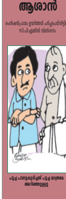
ആശാൻ പെൻഷൻപ്രായം ഉയർത്തൽ ചർച്ചയ്ക്കിടയിൽ വിമർശനം പുഴ പലപ്പോഴും എഴുതിയ ചർച്ചകളുടെ പശ്ചാത്താപം

ത്താൻ ഗവർണ്ണർ തയ്യാറായില്ല. സർക്കാരുമായി തെറ്റിയപ്പോൾ ആണ് എല്ലാം പറയുന്നതെന്നും കെ.സുധാകരൻ പറഞ്ഞു. ഗവർണ്ണറെ വിമർശിക്കേണ്ട ഇടത്ത് വിമർശിച്ചിട്ടുണ്ട്. തങ്ങൾ ഗവർണ്ണറുടെ വക്താവ് അല്ല. തങ്ങൾ ഉന്നയിച്ച ആരോപണം ആണ് ഗവർണ്ണർ പറയുന്നത്. ഗവർണ്ണറെ വച്ച് കേരളത്തിൽ കേന്ദ്രം പിൻസീറ്റ് ഡ്രൈവിംഗ് നടത്തുന്നു എന്ന അഭിപ്രായം കോൺഗ്രസിനല്ല. അതെല്ലാം നടക്കുന്നത് ഉത്തരേന്ത്യയിലാണ്. ഉത്തരേന്ത്യയിലെ പോലീസ് കോമ്പോയിംഗ് ഇവിടെ ഇല്ല. അത് എതിർക്കാൻ ശക്തമായ പ്രതിപക്ഷം ഇവിടെ ഉണ്ട്. കോൺഗ്രസിന് സങ്കുചിത താല്പര്യം ഇല്ല. കേരളത്തിലെ സാഹചര്യത്തിന് അനുസരിച്ചാണ് ഇവിടുത്തെ നിലപാട്. ഗവർണ്ണർ ശരി പറഞ്ഞാൽ അനുകൂലിക്കും, തെറ്റു പറഞ്ഞാൽ എതിർക്കും. കേരളത്തിൽ യുഡിഎഫ് സർക്കാർ ആയിരുന്നെങ്കിൽ ഗവർണ്ണർ ഉണ്ടാണെന്നും ചെയ്തില്ലായിരുന്നു. ഗവർണ്ണറെ വച്ചുള്ള നീക്കം ഒന്നും ഇവിടെ ഇല്ല. ആർഎസ്എസ് പ്രതിനിധിയെ രജിസ്ട്രേഷൻ നിയമിച്ചെങ്കിൽ ആരോപണം ഉന്നയിച്ചുവർ ചൂണ്ടിക്കാണിക്കട്ടെ എന്നും സുധാകരൻ പറഞ്ഞു. മന്ത്രിമാർ ഗവർണ്ണറെ പറ്റി സംസാരിക്കുമ്പോൾ ഒരു പ്രോട്ടോക്കോൾ ഉണ്ട്, അത് പാലിക്കണം. കേരളത്തിൽ ബിജെപി ഒന്നുമില്ല. ഒറ്റ എംഎൽഎ പോലുമില്ലാത്ത ബിജെപിക്ക് എതിരെ ഇവിടെ എതിർപ്പ് സമരം നടത്തണം എന്നും സുധാകരൻ ചോദിച്ചു. സർണക്കടത്ത്, വിസി വിഷയങ്ങളിൽ ഗവർണ്ണർ എന്ന് ചെയ്യുന്നു എന്ന് നോക്കട്ടെ എന്നും കെപിസിസി പ്രസിഡന്റ് പറഞ്ഞു. ഗവർണ്ണർ മാധ്യമപ്രവർത്തകരോട് മുഖം തിരിക്കരുതെന്നും സുധാകരൻ ആവശ്യപ്പെട്ടു.