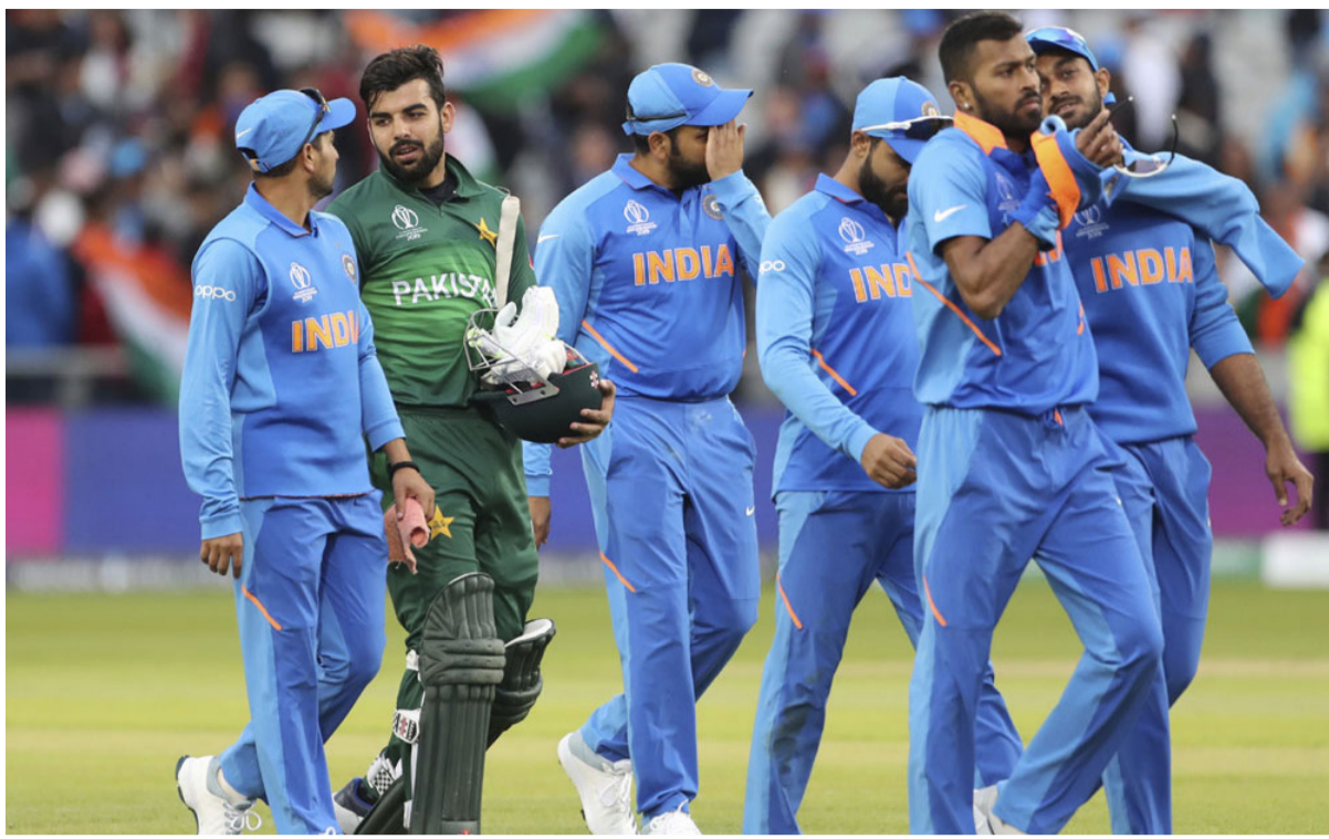
ടോപ്പ് നേടി ബാറ്റിംഗിനിറങ്ങിയ പാകിസ്ഥാൻ മുൻനിര തകർന്നടിഞ്ഞിട്ടും അവിശ്വസനീയ തിരിച്ചുവരവാണ് പാകിസ്ഥാൻ നടത്തിയത്. പാകിസ്ഥാൻ നിശ്ചിത 20 ഓവറിൽ 9 വിക്കറ്റ് നഷ്ടത്തിൽ 189 റൺസാണ് നേടിയത്. ഇഫ്തീഖർ അഹമ്മദിന്റെയും ഷാദബ് ഖാനുമാണ് പാകിസ്ഥാന്റെ രക്ഷകരായി മാറിയത്. ഇരുവരും നേടിയ അർദ്ധസെഞ്ചൂറികളുടെ കരുത്തിലാണ് പാക് ഇന്നിംഗ്സ് മികച്ച സ്കോർ പടുത്തുയർത്തിയത്. 22 പന്തിൽ 52 റൺസെടുത്ത ഷാദബ് ഖാനാണ് പാകിസ്ഥാന്റെ ടോപ്പ് സ്കോറർ. ദക്ഷിണാഫ്രിക്കക്കായി ആന്റീച്ച് നോർകു