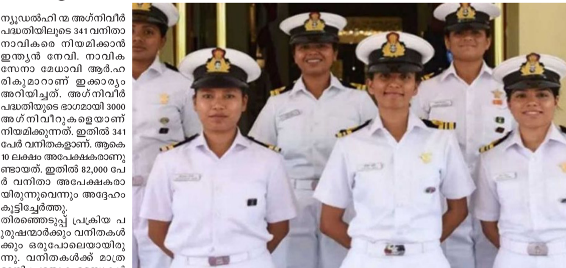
നന്ദിന്റെ ഭാഗമായി വനിതാ ഹൈറ്റർ ന്റും അദ്ദേഹം പറഞ്ഞു. സേനയിൽ പെലറ്റുമാരെയും എയർ ഓപ്പറേഷൻമാരെയും നേരത്തേ നിയമിച്ചിരുന്നു. വരും വർഷങ്ങളിലും വിവിധ തസ്തികകളിൽ സ്ത്രീപങ്കാളിത്തം ഉറപ്പു വരുത്തുമെന്ന് നാവികസേനാ മേധാവി പറഞ്ഞു.