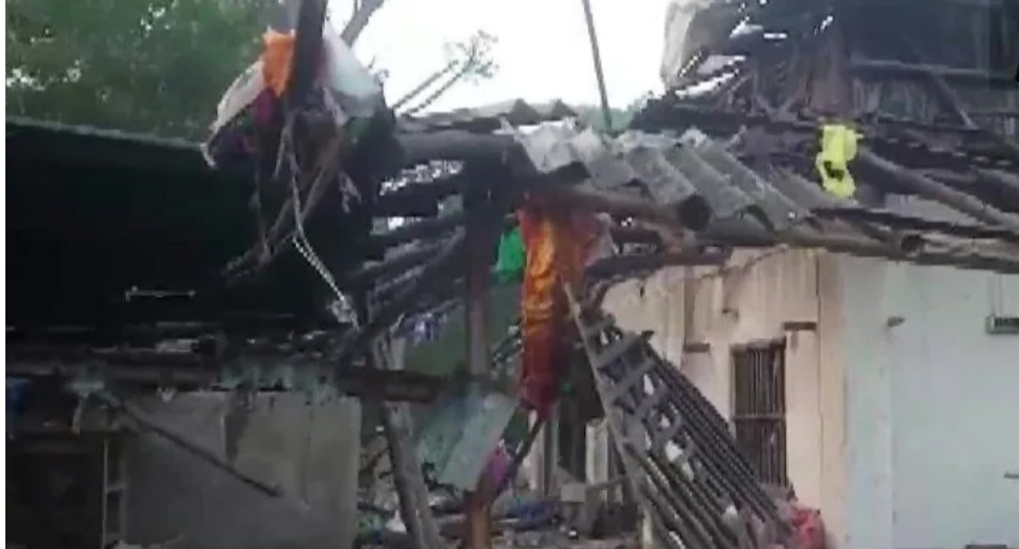
സ്ഫോടനത്തിന്റെ ആഘാതത്തിൽ തൃണമൂൽ കോൺഗ്രസ് നേതാവിന്റെ പുരയുടെ മേൽക്കൂര തെറിപ്പുപായ സ്ഥിതിയിൽ