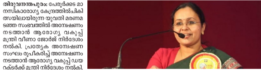
തിരുവനന്തപുരം: പേരൂർക്കട മാതൃകാ രോഗാശുപത്രിയിൽ ചികിത്സയിലായിരുന്ന യുവതി മരണമടഞ്ഞ സംഭവത്തിൽ അന്വേഷണം നടത്താൻ ആരോഗ്യ വകുപ്പ് മന്ത്രി വീണാ ജോർജ്ജ് നിർദ്ദേശം നൽകി. പ്രത്യേക അന്വേഷണ സംഘം രൂപീകരിച്ച് അന്വേഷണം നടത്താൻ ആരോഗ്യ വകുപ്പ് ഡയറക്ടർക്ക് മന്ത്രി നിർദ്ദേശം നൽകി.