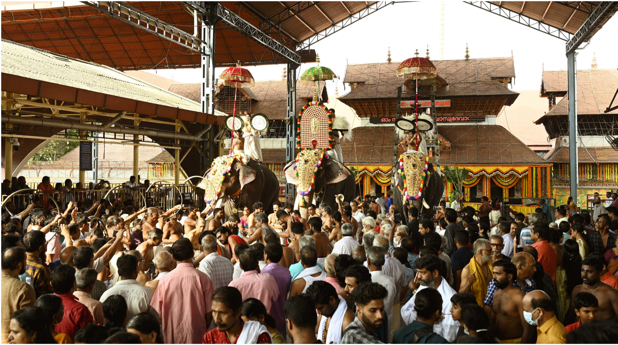
ഏകാദശിയോടനുബന്ധിച്ച് ഗുരുവായൂർ പാർത്ഥസാരഥി ക്ഷേത്രത്തിലേക്കുള്ള എഴുന്നള്ളിപ്പ്