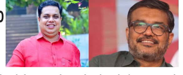
ടി നൽകി. ഒന്നാം പിണറായി സർക്കാരിന്റെ കാലം മുതൽ ഇത് നടക്കുന്നുണ്ടെന്നും മന്ത്രി നിയമസഭയിൽ പറഞ്ഞു.

മുൻ സ്പീക്കർ പരമ്പരയിൽ വളരെ പ്രധാനപ്പെട്ടതൊരു നോട്ടീസിനാണെന്നു പറഞ്ഞ് രാജേഷ് തുടർന്നു. പിന്നാലെ മന്ത്രി പി. രാജീവ് ഉൾപ്പെടെയുള്ളവർ സഭയിൽ കുട്ടിച്ചിരി ഉയർത്തി. ഇതോടെ രാജേഷിനും ഷംസീറിനും ചിരിയടക്കാനായില്ല. പിന്നീട് 'സാധാരണ ഒരൂടെ മുണ്ട്, അതാണ് എന്ന് ഷംസീർ ചിരിച്ച് മറുപടി നൽകുകയായിരുന്നു. എൽ.ഡി.എഫ്. സർക്കാർ ഉദ്യോഗാർത്ഥികളോട് അറിയിക്കാനാണ് വരുത്തിയ അഭിപ്രായം പ്രതിപക്ഷം ശ്രമിക്കുന്നതാണ് നോട്ടീസിന് എം.ബി. രാജേഷ് മറുപ