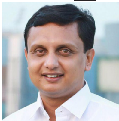
പി.എ. മുഹമ്മദ് റിയാസ് (ടൂറിസം മന്ത്രി)

കോവിഡ് സൃഷ്ടിച്ച മന്ദ്യത്തിൽനിന്ന് എല്ലാ മേഖലയിലും ലോകം ഉണർന്നു വരുമ്പോൾ പൂർവാധികം ശക്തിയോടെ കേരളവും അതിനൊപ്പം സഞ്ചരിക്കുകയാണ്. രണ്ടര-മൂന്നു വർഷം മുൻപ് എന്തായിരുന്നോ കേരളം, അതിനുപുറത്തേക്ക് സമസ്ത മേഖലകളും കൂട്ടിച്ചുരുക്കുന്ന കാഴ്ചയ്ക്കാണ് സാക്ഷ്യം വഹിക്കുന്നത്. ജനങ്ങൾ ഒരുമിച്ചു നിൽക്കുകയും ഒറ്റക്കെട്ടായി പ്രതിബന്ധങ്ങളെ തരണംചെയ്ത് മുന്നേറുകയും ചെയ്യുന്നതുതന്നെയാണ് കേരളത്തിന്റെ ശക്തി. രാജ്യാന്തരതലത്തിൽ ശ്രദ്ധേയമാകുന്ന ഒട്ടേറെ പരിപാടികൾ ഇന്നു കേരളത്തിലുണ്ട്. കായലോരങ്ങളുടെയും ഹിൽസ് റേഞ്ചുകളുടെയും ഏതാനും ബീച്ചുകളുടെയും പരമ്പരാഗത കലാരൂപങ്ങളുടെയും അന്തരീക്ഷമൊരുക്കുന്ന വിനോദസഞ്ചാര സാധ്യതകളിൽനിന്ന് കലയുടെയും സംസ്കാരത്തിന്റെയും പുതിയൊരു തലത്തിലേക്ക് കേരളം സഞ്ചരിക്കാൻ തുടങ്ങിയിട്ട് അധികമാകാതെ കേരളത്തിന്റെ സമ്പന്നമായ ചലച്ചിത്രസാഹചര്യം നാടകസാഹചര്യം ലിറ്റററി ഫെസ്റ്റിവലുകളുമെല്ലാം ഇന്നു വിദേശികളെ ഇവിടെക്ക് ആകർഷിക്കുന്നുണ്ട്. ഇത്തരം പരിപാടികളിലേക്കെത്തുന്നവർക്ക് കേരളം നൽകുന്ന വരവേൽപ്പ് അവരെ അത്ഭുതപ്പെടുത്തുന്നുമുണ്ട്. കലാവിനോദസഞ്ചാരത്തെ വളരുകയും കഥകളിയും തെയ്യവുമൊക്കെ മാത്രമായി ഒതുക്കാതെ കൂടുതൽ വിശാലമാക്കാനാണ് ശ്രമിക്കുന്നത്. അവയിൽ ഏറ്റവും പ്രധാനപ്പെട്ട ഒന്നാണ് കൊച്ചി-മുസിരിസ് ബിനാലെ. കോവിഡ് മൂലം കഴിഞ്ഞതവണ ബിനാലെ മുടങ്ങിയെങ്കിലും പൂർവാധികം ശക്തിയോടെ തിരിച്ചുവരുകയാണ് ഇത്തവണ. കൊച്ചി-