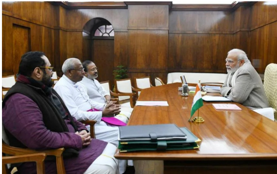
ആർച്ച് ബിഷപ്പ് ആൻഡ്രൂസ് താഴത്ത് പ്രധാനമന്ത്രിയുമായി കൂടിക്കാഴ്ച നടത്തുന്നു. വിദേശകാര്യ സഹമന്ത്രി വി. മുരളീധരൻ, ഐടി സഹമന്ത്രി രാജീവ് ചന്ദ്രശേഖർ എന്നിവർ ഒപ്പം.

പോസ്റ്റിന്റെ പൂർണ്ണരൂപം - "സെൻട്രൽ ബോർഡ് ഓഫ് സെക്കൻഡറി എജ്യൂക്കേഷന്റെ പേരിൽ വ്യാജ വെബ്സൈറ്റ് പ്രവർത്തിക്കുന്നതായി ബോർഡിന്റെ മുന്നറിയിപ്പ്. ഔദ്യോഗിക വെബ്സൈറ്റ് ഉള്ള വ്യാജ വെബ്സൈറ്റ്. ബോർഡിന്റെ യഥാർത്ഥ വെബ്സൈറ്റ് ഓം.യെ.ഐ.സി ആണെന്നും വിദ്യാർത്ഥികളും സ്കൂളുകളും രക്ഷിതാക്കളും ഇതുവഴി ലഭിക്കുന്ന നിർദ്ദേശങ്ങൾ മാത്രം പിന്തുടരണമെന്നും ബോർഡ് അധികൃതർ മുന്നറിയിപ്പ് നൽകിയിട്ടുണ്ട്".