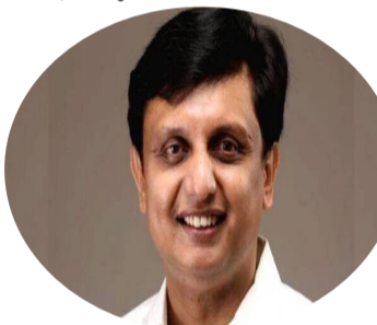
മനം. ഇത് കൂടുതൽ ജനശ്രദ്ധ നേടാൻ പ്രത്യേക പരിപാടി ഒരുക്കുമെന്നും റിയാസ് അറിയിച്ചു.

ന്റെ നടത്തിപ്പിന് പ്രോത്സാഹനവും പ്രമോഷനും നൽകുമെന്നും അദ്ദേഹം കൂട്ടിച്ചേർത്തു. ആളുകൾ കലയാണെന്ന് കഴിക്കാൻ ഇപ്പോൾ ദുരൂഹമാണ് പോകുന്നത്. പണ്ടൊക്കെ ഒളിച്ചോടുന്നവരാണ് ദുരൂഹ പോയി കലയാണെന്ന് കഴിക്കുന്നത്. എന്നാൽ ഇപ്പോൾ ഇവിടെയുള്ളവർ കൂട്ടംബത്തോടൊപ്പം ദുരൂഹപോയി വിവാഹം നടത്തുന്നുവെന്നും അദ്ദേഹം പറഞ്ഞു. അതിനാലാണ് ഈ പുതിയ പദ്ധതി. കൂടാതെ കേരളത്തിന്റെ സിനിമ ടൂറിസത്തിന്റെ കേന്ദ്രമാക്കി ബേക്കൽ കേന്ദ്രമാണെന്ന് തിരു