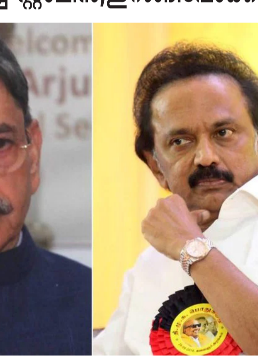
ഭാഗങ്ങൾ ഒഴിവാക്കി ഗവർണ്ണർ കൂട്ടിച്ചേർത്ത ഭാഗങ്ങൾ രേഖകളിൽ നിന്ന് നീക്കണമെന്ന് ആവശ്യപ്പെട്ട മുൻമന്ത്രി എം.കെ. സ്റ്റാലിൻ പ്രമേയം പാസാക്കി. ഇതിൽ അത്യന്തി പ്രകടിപ്പിച്ച് ഗവർണ്ണർ സഭയിൽ നിന്ന് ഇറങ്ങിപ്പോയി. സംസ്ഥാനത്തിന്റേ പേർ തമിഴ് നാട് എന്നതിന് പകരം തമിഴ്നാട് എന്നാണെന്ന ആർ.എൻ. രവിയുടെ പ്രസ്താവനയ്ക്കെതിരെ, അദ്ദേഹം പ്രസംഗം ആരംഭിച്ചപ്പോൾ തന്നെ

ചെന്നൈ: തമിഴ് നാട് നിയമസഭയിലെ നയപ്രഖ്യാപന പ്രസംഗത്തിലെ വിവിധ പരാമർശങ്ങൾ ഗവർണ്ണർ ഒഴിവാക്കിയതിനെത്തുടർന്ന് നിയമസഭയിൽ ബഹളം പെരിയാർ, ബി.ആർ. അംബേദ്കർ, കെ. കാമരാജ്, അണ്ണാദുരൈ എന്നിവരെക്കുറിച്ച് പ്രതിപാദിക്കുന്ന ഭാഗമാണ് ഗവർണ്ണർ വായിക്കാതെ വിട്ടുകൊടുത്തത്. പ്രസംഗത്തിലെ 65-ാം ഖണ്ഡികയിലെ ദ്രാവിഡ മോഡൽ എന്ന പ്രയോഗവും ഗവർണ്ണർ നിയമസഭയിൽ വായിച്ചില്ല. ഗവർണ്ണർ വിട്ടുകൊടുത്ത ഭാഗങ്ങൾ സ്പീക്കർ പരിഭാഷയിൽ വായിച്ചു. മന്ത്രിസഭ അംഗീകരിച്ച പ്രസംഗത്തിലെ ഭാഗങ്ങൾ ഒഴിവാക്കിയ ഗവർണ്ണർ അദ്ദേഹത്തിന്റേതായ കൂട്ടിച്ചേർക്കലുകൾ നടത്തി. പെരിയാറിന്റേയും അംബേദ്കറിന്റേയും കാമരാജിന്റേയും അണ്ണാദുരൈയുടേയും കരുണാനിധിയുടേയും സിദ്ധാന്തങ്ങളും ആശയങ്ങളും പിൻതുടരുന്ന സർക്കാർ ദ്രാവിഡ മോഡൽ ഭരണമാണെന്ന് കാഴ്ചവെക്കുന്നത് എന്ന് ഭാഗമാണ് ഒഴിവാക്കിയത്. ഈ ഖണ്ഡികയിലെ ഒഴികെ എല്ലാഭാഗത്തും മുൻ മുഖ്യമന്ത്രി കരുണാനിധിയുടെ പേർ ഗവർണ്ണർ വായിക്കുകയോ ചെയ്തു. സംസ്ഥാനത്തിന്റെ പ്രകടനമാധ്യമ നിലയെക്കുറിച്ച് പ്രതിപാദിക്കുന്ന ഭാഗവും ഗവർണ്ണർ ഒഴിവാക്കിയിരുന്നു. സമാധാനത്തിന്റെ തുറമുഖമായി തമിഴ് നാട് മാറി എന്നും വിദേശ നിക്ഷേപകരെ വലിയ തോതിൽ ആകർഷിക്കുന്നതുവെന്നും എല്ലാമേഖലയിലും പുരോഗതി പ്രാപിക്കുന്നതുവെന്നുമുള്ള ഭാഗമാണ് ഒഴിവാക്കിയത്. എന്നാൽ, പ്രസംഗത്തിലെ ചില