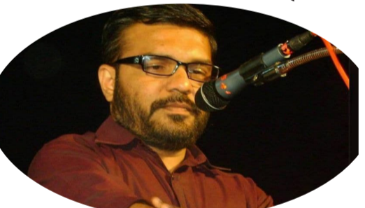
സാഹചര്യം മാറിയിട്ടുണ്ട്. ഇപ്പോഴും അതേ തോതിലുള്ള ഇളവ് നൽകേണ്ട സമിതിയില്ല. എങ്കിലും നിലവിലെ മത്സരത്തിനും 12 ശതമാനമായി വിനോദനികുതി ഇളവ് നൽകിയിട്ടുണ്ട്.

തിരുവനന്തപുരം: തദ്ദേശ സമ്പരണ വകുപ്പ് കാര്യവും ഏകദിനത്തിന്റെ വിനോദനികുതി കുറയ്ക്കുന്ന മാധ്യമവാർത്തകൾ വാസ്തവവിരുദ്ധമാണെന്ന് തദ്ദേശ സമ്പരണ ഏജൻസി വകുപ്പ് മന്ത്രി എം.ബി. രാജേഷ് അറിയിച്ചു. 24 ശതമാനം മുതൽ 50 ശതമാനം വരെ വാങ്ങാമായിരുന്നു വിനോദനികുതി 12 ശതമാനമായി കുറയ്ക്കുന്നതിന് തദ്ദേശ സമ്പരണ വകുപ്പ് ചെയ്തത്. തിരുവനന്തപുരം കോർപ്പറേഷനോടും സംഘടനകളായ കേരള ക്രിക്കറ്റ് അസോസിയേഷനോടും ചർച്ച ചെയ്തത്. ഇതുകൂടുതലായും സമ്മതപ്രകാരമാണ് നികുതിനിരക്ക് നിശ്ചയിച്ചത്. കാര്യവട്ടത്ത് നടന്ന കഴിഞ്ഞ അന്താരാഷ്ട്ര ക്രിക്കറ്റ് മത്സരത്തിന് 24 ശതമാനത്തിൽ നിന്ന് അഞ്ച് ശതമാനമായി വിനോദനികുതി കുറച്ചിരുന്നു. ദീർഘകാലം സ്റ്റേഡിയത്തിൽ മത്സരമില്ലാതിരുന്നതും സംഘടനകൾക്ക് സ്റ്റേഡിയം മത്സരത്തിനായി ഒരുക്കുക ദുഷ്കരമാവുകയും ചെയ്ത സാഹചര്യത്തിലായിരുന്നു അന്ന് വലിയ തോതിൽ ഇളവ് അനുവദിച്ചത്.