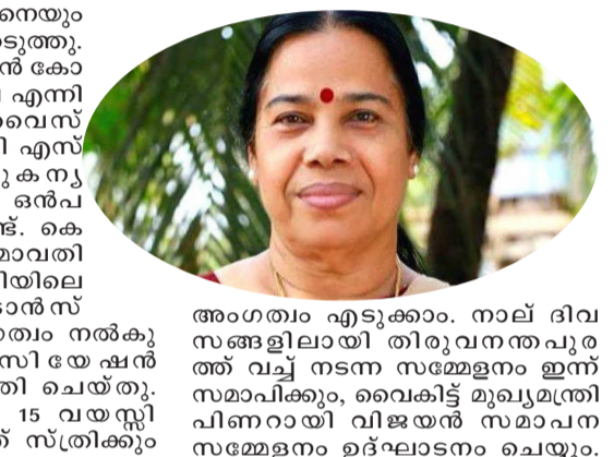
അംഗത്വം എടുക്കാം. നാല് ദിവസങ്ങളിലായി തിരുവനന്തപുരത്ത് വച്ച് നടന്ന സമ്മേളനം ഇന്ന് സമാപിക്കും. വൈകിട്ട് മുഖ്യമന്ത്രി പിണറായി വിജയൻ സമാപന സമ്മേളനം ഉദ്ഘാടനം ചെയ്യും.