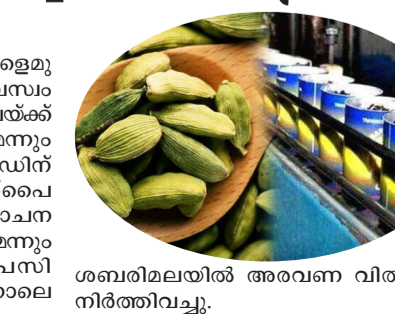
ശബരിമലയിൽ അരവണ വിതരണം നിർത്തിവച്ചു.