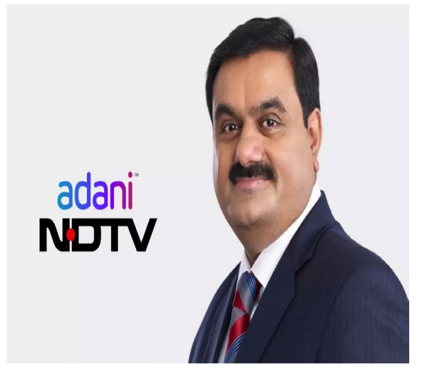
തുപയിലാണ് എൻഡിടിവി ഓഹരികളുടെ വ്യാപാരം.

ശേഷമുള്ള 26 ആഴ്ചകൾക്കുള്ളിൽ നടക്കുന്ന ഓഹരി വാങ്ങലുകൾക്കും സമാന തുക നൽകണമെന്ന നിയമം ലംഘിച്ചുകൊണ്ടായിരുന്നു ഇടപാട്.