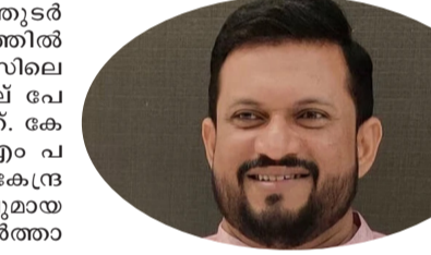
ഹൈക്കോടതിയെ സമീപിക്കുമെന്ന് മുഹമ്മദ് ഫൈസലിന്റെ അഭിഭാഷകൻ അറിയിച്ചു.