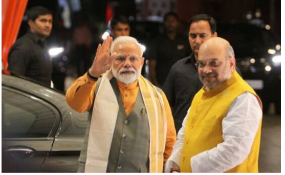
2024ലും പ്രധാനമന്ത്രി സ്ഥാനാർത്ഥി നരേന്ദ്ര മോദി തന്നെയെന്ന് വ്യക്തമാക്കി അമിത് ഷാ

ബി.ഐ.എസ്. സർട്ടിഫിക്കറ്റ് നിർവ്വഹണമാക്കും പുതിയ സംവിധാനം നിലവിൽ വരുന്നതോടെ ഇ-കൊമേഴ്സ് കമ്പനികൾ മുഖേന സാധനങ്ങൾ വിൽക്കാൻ ബി.ഐ.എസ്. സർട്ടിഫിക്കറ്റ് ഹാജരാക്കേണ്ടത് നിർബന്ധമാക്കും. ഈ സർട്ടിഫിക്കറ്റ് യഥാർത്ഥമാണോയെന്ന് ബി.ഐ.എസ്. സംവിധാനം വഴി ഓട്ടോമാറ്റിക്കായി പരിശോധിക്കും. വ്യാജമാണെന്ന് കണ്ടെത്തിയാൽ വിൽപന വിലക്കും ഉൽപ്പന്നങ്ങളുടെ ബി.ഐ.എസ്. നിലവാര കമ്പനികൾ വെബ്സൈറ്റുകളിൽ പ്രദർശിപ്പിക്കും. നിലവാരമില്ലാത്തതെങ്കിൽ ഉൽപ്പന്നങ്ങൾ തിരിച്ചയക്കാൻ വ്യവസ്ഥയുണ്ടാകും.