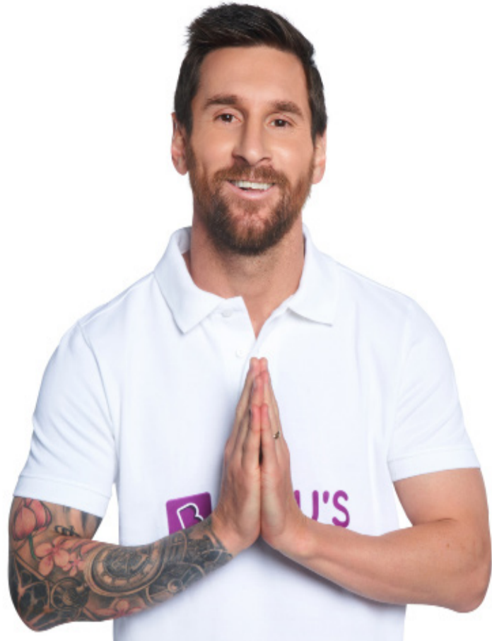
കേഷൻ ഫോർ ഓൾ എന്ന പദ്ധതിക്ക് കഴിയുമെന്ന് ഞങ്ങൾക്ക് ഉറപ്പുണ്ട്. അഭിമുഖത്തിന്റെ വിഡിയോ ലിങ്ക്: https://www.youtube.com/watch?v=4WeCslwiXqE