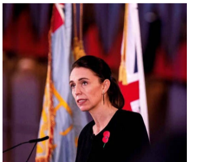
അന്ന് അവർക്ക് വെറും മുപ്പത്തിയെഴുപതു മാത്രമായിരുന്നു പ്രായം. ലോകത്തെ ഏറ്റവും പ്രായം കുറഞ്ഞ പ്രധാനമന്ത്രിയായിരുന്നു അവർ.

മല്ലെന്ന് മനസ്സിലാക്കി അതിനനുസരിച്ച് അത് മാറ്റിയെന്നും അനുബന്ധ ടീറ്റുകളും ഇല്ലാതാക്കിയെന്നും ബി ബി സി വക്താവ് അറിയിച്ചു. അതേസമയം, പ്രധാനമന്ത്രി സ്ഥാനവും ലേബർ പാർട്ടി നേതൃസ്ഥാനവും രാജിവയ്ക്കുമെന്ന് തീരുമാനത്തിൽ മാറ്റമില്ലെന്ന് ആവർത്തിച്ച് ജസീന്ത ആർഡെൻ രംഗത്തെത്തി. ഇതിൽ തനിക്ക് പഴയ തൊഴിലില്ലായ്മ കുടുംബശ്രീയോടൊപ്പം കുടുതൽ സമയം ചിലവഴിക്കാൻ ആഗ്രഹിക്കുന്നുണ്ടെന്നും അവർ പറഞ്ഞു. ഫെബ്രുവരി ഏഴിനാണ് ജസീന്ത സ്ഥാനമൊഴിയുന്നത്. പുതിയ നേതാവിലേക്കും പ്രധാനമന്ത്രിയെയും തിരഞ്ഞെടുക്കാനുള്ള നടപടികൾ ലേബർ പാർട്ടി ഇതിനോടകം ആരംഭിച്ചിട്ടുണ്ട്. 2017ലാണ് ന്യൂസിലാന്റിലെ പ്രധാനമന്ത്രിയായി ജസീന്ത അധികാരമേറ്റത്.