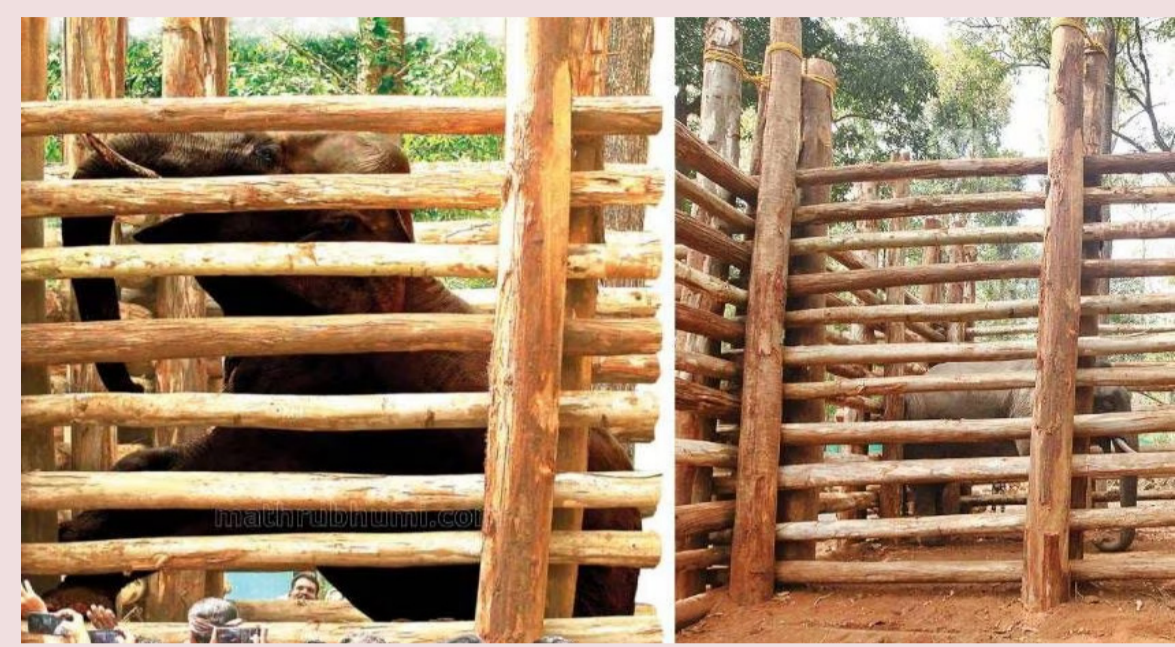
2023 ജനുവരി-ഒന്ന് ധോണിയിൽ കൂട്ടിൻമിക്കാൻ പദ്ധതി തയ്യാറാക്കി. വനനാട്ടിലേക്ക് മാറ്റിയിട്ടുള്ള വനംവകുപ്പ് വൈൽഡ് ലൈഫ് ലൈഫ് വാർഡന്റെ ഉത്തരവുപ്രകാരം 26 അംഗസംഘം ധോണിയിൽ കൂട്ടിൻമിക്കാൻ തുടങ്ങി. 2023 ജനുവരി എട്ട് കൂങ്കിയാനകളുമായി ആർ.ആർ.ടി. സംഘം വിണ്ടും കാട്ടിലേക്ക്. രാത്രി പലഭാഗത്തും ആനയെത്തുന്നിടങ്ങളിലും വലയത്തിലാക്കാൻ കഴിഞ്ഞില്ല. 2023-ജനുവരി 14-ജനവാസമേഖലയിൽ രാത്രി വിണ്ടും 'പി.ടി.7' എത്തി. വ്യാപക കൂങ്കിയാനം. മുപ്പത്തൊന്നര ഓരോരും കൊയ്ത്ത് കർഷകർ. തുടർന്ന് എല്ലാദിവസങ്ങളിലും ജനവാസമേഖലയിൽ വിലസി 'പി.ടി.7' 2023 ജനുവരി 19-ആനക്കൂട്ടിൻമിക്കാൻ പുറത്തിറങ്ങി.