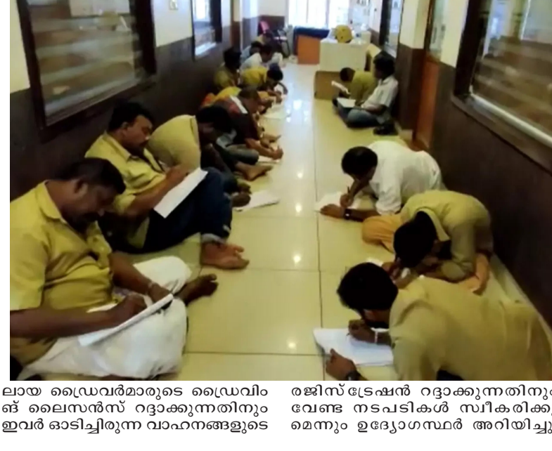
ലായ ഡ്രൈവർമാരുടെ ഡ്രൈവിംഗ് ലൈസൻസ് റദ്ദാക്കുന്നതിനും ഇവർ ഓടിച്ചിരുന്ന വാഹനങ്ങളുടെ രജിസ്ട്രേഷൻ റദ്ദാക്കുന്നതിനും വേണ്ട നടപടികൾ സ്വീകരിക്കുമെന്നും ഉദ്യോഗസ്ഥർ അറിയിച്ചു.