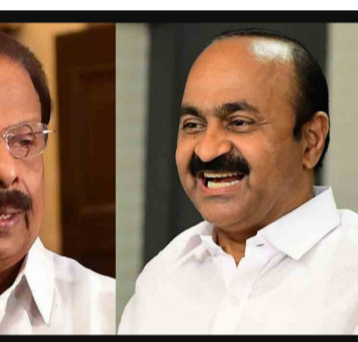
കശാപ്പ് ചെയ്യുന്നു. മുഖ്യമന്ത്രിയുടെ പൊതു പരിപാടിയുടെ കേൾവി പ്രദേശത്ത് കോൺഗ്രസ് പ്രവർത്തകർക്ക് സമ്മേളനം നടത്താനോ കറുപ്പ് വസ്ത്രമിടാനോ സാധിക്കാത്ത സാഹചര്യമാണ് നിലവിൽ. അടിയന്തരാവസ്ഥ കാലത്ത് പോലും കേട്ടുകേൾവിയില്ലാത്ത കാര്യങ്ങളാണ് നിലവിലെ പോലീസ് നടപടികളെന്നും അദ്ദേഹം കുട്ടിച്ചേർത്തു.

സുപ്രീം കോടതി ഉത്തരവുണ്ട്. ഏത് നിയമത്തിന്റെ അടിസ്ഥാനത്തിലാണ് കോൺഗ്രസ് പ്രവർത്തകരെ കരുതൽ തടങ്കലിലെടുക്കുന്നതെന്നും അദ്ദേഹം ചോദിച്ചു. എറണാകുളത്ത് പ്രതിഷേധത്തിനിടെ ഒരു പെൺകുട്ടിയെ പോലീസ് ഉദ്യോഗസ്ഥൻ വലിച്ചിഴച്ച നടപടിയേയും അദ്ദേഹം ചോദ്യം ചെയ്തു. ഭയം കൊണ്ട് ഭരിക്കുന്ന ഏകാധിപതിയായി മുഖ്യമന്ത്രി മാറിയെന്നും വി.ഡി. സതീശൻ കുറ്റപ്പെടുത്തി. അതേസമയം കരിങ്കൊടി പ്രതിഷേധത്തെ പോലും സഹിഷ്ണുതയോടെ നേരിടാനാകാത്ത ഭീരുവാണ് മുഖ്യമന്ത്രിയെന്ന് കെ. സുധാകരൻ പരിഹസിച്ചു. ജനാധിപത്യത്തിൽ പ്രതിഷേധിക്കാനും പ്രതികരിക്കാനും മുഖ്യമന്ത്രി സാതന്ത്ര്യം മുഖ്യമന്ത്രി