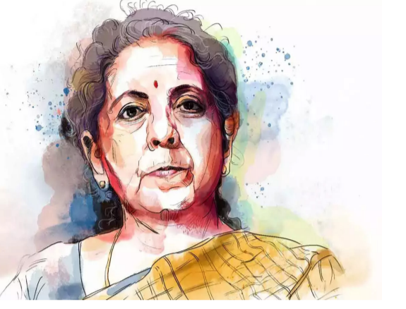
60:40 എന്ന അനുപാതയിൽ പങ്കിടണമെന്നാണ് വിദേശസമിതി ശുപാർശയെങ്കിലും നിലവിൽ തുല്യമായാണ് വരുമാനം വിതരിക്കപ്പെടുന്നത്.

2017 ജൂലായ് ഒന്നിന് ജി എസ് ടി നഷ്ടപരിഹാരമുണ്ടാകാൻ സാധിക്കുമെന്ന് സർക്കാർ അറിയിച്ചിരുന്നുവെങ്കിലും ഇത് നടപ്പാക്കാൻ കഴിയാതെ പോയി. 2017 ജൂലായ് ഒന്നിന് ജി എസ് ടി നഷ്ടപരിഹാരമുണ്ടാകാൻ സാധിക്കുമെന്ന് സർക്കാർ അറിയിച്ചിരുന്നുവെങ്കിലും ഇത് നടപ്പാക്കാൻ കഴിയാതെ പോയി. 2017 ജൂലായ് ഒന്നിന് ജി എസ് ടി നഷ്ടപരിഹാരമുണ്ടാകാൻ സാധിക്കുമെന്ന് സർക്കാർ അറിയിച്ചിരുന്നുവെങ്കിലും ഇത് നടപ്പാക്കാൻ കഴിയാതെ പോയി. 2017 ജൂലായ് ഒന്നിന് ജി എസ് ടി നഷ്ടപരിഹാരമുണ്ടാകാൻ സാധിക്കുമെന്ന് സർക്കാർ അറിയിച്ചിരുന്നുവെങ്കിലും ഇത് നടപ്പാക്കാൻ കഴിയാതെ പോയി.