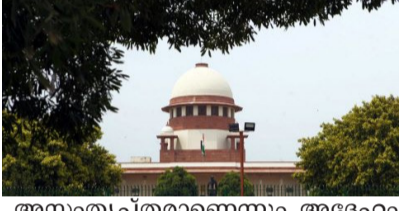
അസംതൃപ്തരാണെന്നും അദ്ദേഹം കുട്ടിച്ചേർത്തു.

സംഘടനാ നിയമത്തിനെതിരായ ഹർജി നിലവിൽ സുപ്രീംകോടതിയുടെ ഭരണഘടനാ ബെഞ്ചിന്റെ പരിഗണനയിലാണ്. ആ ഹർജികളുടെ മെറിറ്റുമായി ബന്ധപ്പെട്ട ഒരഭിപ്രായവും രേഖപ്പെടുത്തുന്നില്ലെന്നും ജസ്റ്റിസ് സന്ജയ് കിഷൻ കൗറിന്റെ അധ്യക്ഷതയിലുള്ള ബെഞ്ചു വ്യക്തമാക്കി. യാത്രയ്ക്കിടെ കണ്ട എല്ലാ കർഷകരും