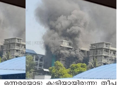
ഒന്നരയോടുകൂടിയിരുന്നു തീപിടിത്തമുണ്ടായത്. സുരക്ഷാ ഉദ്യോഗസ്ഥരുടേയും ലിഫ്റ്റ് ഓപ്പറേറ്ററുടേയും അവസരോപിതമായ ഇടപെടൽ മൂലം വൻ നാശനഷ്ടങ്ങൾ ഒഴിവാക്കുകയായിരുന്നു.

ഉണ്ടായിരുന്നു. തീ പിടിത്തത്തിന്റെ കാരണം വ്യക്തമല്ല. നിർമ്മാണ ആവശ്യങ്ങൾക്കായി ഇവിടെ ചില വൈദ്യുത ക്രമീകരണങ്ങൾ നടന്നിരുന്നു. ഇതിൽ നിന്നുള്ള ഷോർട്ട് സർക്യൂട്ടാവാം അപകടകാരണമെന്നാണ് പ്രാഥമിക നിഗമനം. ഇക്കഴിഞ്ഞ ജനുവരിയിലും കോട്ടയം മെഡിക്കൽ കോളേജിൽ തീപിടിത്തമുണ്ടായിരുന്നെങ്കിലും രോഗികളെ ലെക്ചർ ഹാളിൽ ഉച്ചയ്ക്ക്