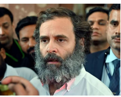
വിഷയത്തിൽ അനിശ്ചിതത്വം അവസാനിപ്പിക്കണമെന്നും രാഹുൽ ആവശ്യപ്പെട്ടു. ഭാരത് ജോഡോ യാത്രയ്ക്കിടെ കണ്ട എല്ലാ കർഷകരും അസംതൃപ്തരാണെന്നും അദ്ദേഹം കുട്ടിച്ചേർത്തു.