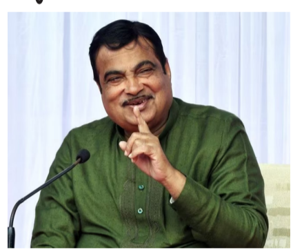
എമനോൾ, മെമനോൾ, ബയോ-സി.എൻ.ജി., ബയോ-എൽ.എൻ.ജി., ഇലക്ട്രിക് വാഹനങ്ങൾ എന്നിവയുടെ ഉപയോഗം പ്രോത്സാഹിപ്പിക്കാൻ കേന്ദ്രസർക്കാർ പല ചുവടുവെപ്പുകളും നടത്തുന്നുണ്ടെന്നും ഗഡ്കരി പറഞ്ഞു. എഫ്.ഐ.സി.സി. സംഘടിപ്പിച്ചു.

ന്യൂഡൽഹി: കേന്ദ്ര-സംസ്ഥാന സർക്കാരുകൾ, ട്രാൻസ്പോർട്ട് കോർപ്പറേഷനുകൾ, പൊതുമേഖലാ സ്ഥാപനങ്ങൾ എന്നിവയുടെ ഉടമസ്ഥതയിലുള്ളതും പതിനഞ്ചു വർഷത്തിൽ അധികം പഴക്കമുള്ളതുമായ വാഹനങ്ങൾ ഏപ്രിൽ ഒന്നുമുതൽ പൊളിച്ചു തുടങ്ങുമെന്ന് കേന്ദ്ര ഉപരിതല ഗതാഗതവകുപ്പുമന്ത്രി നിരീന്ദ ഗഡ്കരി. ഇത്തരത്തിലുള്ള ഒൻപതുലക്ഷത്തിലധികം വാഹനങ്ങളാണ് പൊളിക്കുക. പതിനഞ്ച് കൊല്ലത്തിലധികം പഴക്കമുള്ള ഒൻപത് ലക്ഷത്തിലേറെ വാഹനങ്ങൾ പൊളിക്കാൻ അനുബന്ധിച്ച് നൽകിയിട്ടുണ്ട്. മലിനീകരണമുണ്ടാക്കുന്ന കാറുകളും ബസ്സുകളും നിരത്തുകളിൽ ഇല്ലാതാകും. അവയ്ക്കുപകരം മറ്റ് ഇന്ധനസ്രോതസ്സുകളെ ആശ്രയിക്കുന്ന പുതിയ വാഹനങ്ങൾ നിരത്തിലേത്തും, ഗഡ്കരി പറഞ്ഞു. വായു മലിനീകരണം വലിയതോതിൽ കുറയ്ക്കാൻ ഇത് സഹായകമാകുമെന്നും മന്ത്രി കുട്ടിച്ചേർത്തു.