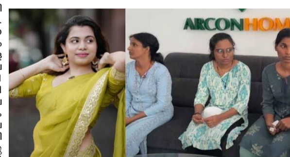
തട്ടിക്കൊണ്ടുപോകൽ, ഭീഷണിപ്പെടുത്തി പണം തട്ടിയെടുക്കൽ എന്നീ വകുപ്പുകൾ ചുമത്തിയാണ് ജീവനക്കാരികൾ നൽകിയ പരാതിയിൽ കേസെടുത്തിരിക്കുന്നത്. തട്ടിക്കൊണ്ടുപോയിട്ടില്ലെന്ന് തെളിയിക്കുന്ന തരത്തിലുള്ള സി.സി. ടിവി ദൃശ്യങ്ങൾ പുറത്തുവന്നിരുന്നു.