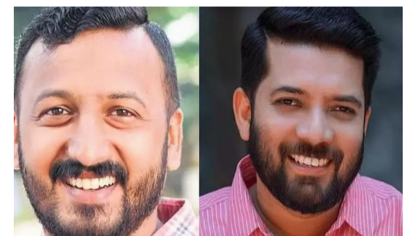
പറഞ്ഞപ്പോഴാണ് പ്രതികരിച്ചതെന്നും നിർബന്ധിച്ചപ്പോഴാണ് പരിശോധിച്ചതെന്നും ഷാഹി പരമ്പിൽ പറഞ്ഞു. എല്ലാവരുടെയും വാഹനങ്ങൾ പരിശോധിക്കുമെന്നും ഇടത് എം.പി കെ.രാധാകൃഷ്ണന്റെ വാഹനവും പരിശോധിച്ചിരുന്നെന്നും ഉദ്യോഗസ്ഥർ പറഞ്ഞു. തിരഞ്ഞെടുപ്പ് കമ്മീഷൻ അവരുടെ ജോലി ചെയ്യുന്നതിൽ അത്ഭുതമില്ലെന്നും എൽ.ഡി.എഫ് കാര്യം വാഹനവും പരിശോധിച്ചിട്ടുണ്ടെന്നും സി.പി.എം സംസ്ഥാന സെക്രട്ടറി എം.വി.രോവിന്ദൻ പറഞ്ഞു. വാഹന പരിശോധന തിരഞ്ഞെടുപ്പ് കമ്മീഷന്റെ നടപടിക്രമമാണെന്നും അതിൽ സർക്കാരിന് പങ്കില്ലെന്നും എൽ.ഡി.എഫ് കൺവീനർ ടി.പി.രാമകൃഷ്ണൻ പറഞ്ഞു. വാഹനത്തിലുണ്ടായിരുന്നവരെ മനസ്സിലായില്ലെന്നാണ് പരിശോധനയുടെ ചുമതലയുള്ള ഉദ്യോഗസ്ഥർ പറഞ്ഞത്.

മലപ്പുറം: പാലക്കാട് ഉപതിരഞ്ഞെടുപ്പിന് പിന്നാലെ നിലമ്പൂരിലും പെട്ടി വിവാദം. ഷാഹി പരമ്പിൽ എം.പി. രാഹുൽ മാങ്കുട്ടത്തിൽ എം.എൽ.എ. യുത്ത് ലീറ്റ് നേതാവ് പി.കെ. ഫിറോസ് എന്നിവർ സഞ്ചിപ്പി കാർ വെള്ളിയാഴ്ച രാത്രി പത്തിന് വടപുറത്ത് തടഞ്ഞ് പൊലീസ് പരിശോധിച്ചതാണ് രാഷ്ട്രീയ പോരിന് തുടക്കമിട്ടത്. സി.പി.എം നേതാക്കളുടെ വാഹനങ്ങൾ പരിശോധിക്കാത്ത പൊലീസ് കോൺഗ്രസ്സ് കാർ മാത്രം ലക്ഷ്യം വയ്ക്കുന്നത് ആസൂത്രിതമാണെന്ന് കോൺഗ്രസ് ആരോപിച്ചു. അനാവശ്യ വിവരങ്ങൾ ഉന്നയിച്ച് തിരഞ്ഞെടുപ്പിനെ വഴിതിരിച്ച് വികൃതമാണെന്നും സി.പി.എം നേതാക്കളുടെ വാഹനങ്ങളും പരിശോധിച്ചിട്ടുണ്ടെന്നും സി.പി.എം വാദിക്കുന്നു. ഷാഹി പരമ്പിലിന്റെ കാരിലായിരുന്നു നേതാക്കൾ യാത്ര ചെയ്തിരുന്നത്. പെട്ടികൾ പൊലീസ് തുറന്ന് പരിശോധിച്ചെങ്കിലും വസ്തുക്കളും പ്യൂർകളും മാത്രമാണ് ഉണ്ടായിരുന്നത്. പെട്ടിമുളച്ചിട്ട് എം.എൽ.എയും എം.പിയുമായതല്ലെന്നും ഇത്തരമെ കണ്ടിട്ടാണ് വരുന്നതെന്നും ഉദ്യോഗസ്ഥരോട് ഷാഹി പരമ്പിൽ പറയുന്ന ദൃശ്യങ്ങൾ പുറത്തുവന്നിട്ടുണ്ട്. സി.പി.എമ്മിന്റെ പണി ചെയ്യുകയാണെങ്കിൽ അത് ചെയ്യാതെ മതിയെന്നും സർവ്വീസിനുള്ള പാരിതോഷികം തരാം, ഓർത്ത് വെച്ചു എന്നും ഉദ്യോഗസ്ഥരോട് രാഹുൽ കയർക്കുന്നുണ്ട്. പൂർണ്ണമായി സഹകരിച്ചെന്ന് ഷാഹി