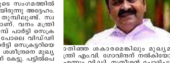
വനംമന്ത്രിക്ക് മറുപടി പറയാതെ പ്രായം പരിഗണിച്ച് വി.ഡി. സതീശൻ ചോദിച്ചു.

മലപ്പുറം: വഴിക്കടവിൽ പന്നിക്കെണിയിൽ കുടുങ്ങി വിദ്യാർത്ഥി മരിച്ച സംഭവത്തിൽ പ്രതിപക്ഷ ഗൂഢാലോചനയുണ്ടെന്ന് ആരോപിച്ച വനംമന്ത്രി എ.കെ. ശശീന്ദ്രൻ മറുപടി പറയാതെ അദ്ദേഹത്തിന്റെ പ്രായം പരിഗണിച്ചാണ് പ്രതിപക്ഷ നേതാവ് വി.ഡി. സതീശൻ പറഞ്ഞു. നിലമ്പൂരിൽ വനജീവി ആക്രമണങ്ങളിൽ ജീ