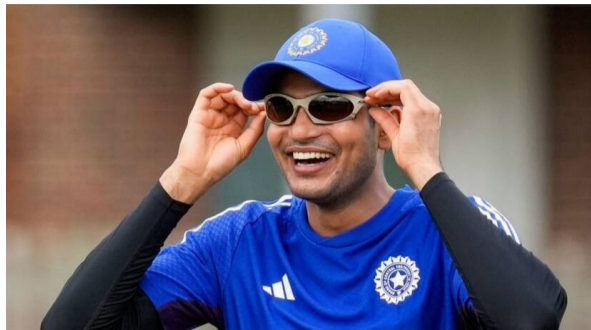
ടെസ്റ്റ്-20 മത്സരങ്ങളുമാണുള്ളത്. ഈമാസം 19,23,25 തീയതി കളിലാണ് ഏകദിനം. ടെസ്റ്റ്-20യിൽ സൂര്യ അന്ന സൂര്യകുമാർ യാദവ് നയിക്കുന്ന ടെസ്റ്റ്-20 ടീമിൽ നിതീഷ് കുമാർ റെഡ് ബോൾ തിരിച്ചെത്തി. ഓസ്ട്രേലിയൻ പര്യടനത്തിനുള്ള ഇന്ത്യൻ ടീം ഏകദിനം: ഗിൽ (ക്യാപ്റ്റൻ), രോഹിത്, വിരാട്, ശ്രേയസ് (വൈസ് ക്യാപ്റ്റൻ), അക്ഷർ , കെ.എൽ. രാഹുൽ, ഡ്രാൻ ജൂറൽ (വിക്ടോ ക്യാപ്റ്റൻ), നിതീഷ് , സുന്ദർ, കുൽദീപ , ഹർഷിത് റാണ, സിറാജ്, അർഷദീപ്, പ്രസീദ് യശസ്വി. ടെസ്റ്റ്-20 സൂര്യകുമാർ (ക്യാപ്റ്റൻ), അഭിഷേക് ശർമ, ശുഭ്മാൻ ഗിൽ (വൈസ് ക്യാപ്റ്റൻ), തിലക് , നിതീഷ്, ശിവാ ദ്വൈബ, അക്ഷർ പട്ടേൽ, ജിതേഷ് ശർമ (വിക്ടോ ക്യാപ്റ്റൻ), വരാൺ, ബുറയ്, അർഷദീപ്, കുൽദീപ്, ഹർഷിത്, സഞ്ജയ് (വിക്ടോ ക്യാപ്റ്റൻ), റിങ്കു, സുന്ദർ.

രോഹിതും കൊഹ്ലിയും ടീമിൽ ശ്രേയസ് അയ്യർ വൈസ് ക്യാപ്റ്റൻ മുറുബയ്: ഓസ്ട്രേലിയയെതിരെ ഏകദിന പരമ്പരയ്ക്കുള്ള ഇന്ത്യൻ ടീമിന്റെ ക്യാപ്റ്റനായി ശുഭ്മാൻ ഗില്ലിനെ നിയമിച്ചു. രോഹിത് ശർമ്മയ്ക്ക് പകരക്കാരനായി ടെസ്റ്റിന് പിന്നാലെ ഏകദിനത്തിലും ശുഭ്മാൻ ഗില്ലിന് ബി.സി സി.ഐ നായകസ്ഥാനം കൈമാറിയതോടെ ഇന്ത്യൻ ടീമിന് ഇന്ത്യൻ നായകനായിരിക്കുമെന്നാണ് വിലയിരുത്തൽ. 2027 ലെ ഏകദിന ലോകകപ്പ് മുന്നിൽ കണ്ടാണ് ടീം പ്രഖ്യാപനമെന്നാണ് സെലക്ടർമാരുടെ പക്ഷം. ക്യാപ്റ്റൻ സ്ഥാനം മാറുന്നത് സംബന്ധിച്ച് രോഹിതുമായി ചർച്ച നടത്തിയതിന് ശേഷമാണ് തീരുമാനമെടുത്തതെന്ന് ചി ഫ് സെലക്ടർ അജിത് അഗാർക്കർ അറിയിച്ചു. അതേസമയം രോഹിതിനെയും കൊഹ്ലിയെയും 15 അംഗ ടീമിൽ ഉൾപ്പെടുത്തിയിട്ടുണ്ട്. ടെസ്റ്റ്-20യിൽ നിന്നും ഏകദിനങ്ങളിൽ നിന്നും നേരത്തേ തന്നെ വിരമിച്ച ഇരുവരും നിലവിൽ ഏകദിനത്തിൽ മാത്രമാണ് കളിക്കുന്നത്. ഇന്ത്യചാമ്പ്യൻമാരായ ചാമ്പ്യൻസ് ട്രോഫിയിലാണ് ഇരുവരും അവസാനമായി ദേശീയ ജേഴ്സി അണിഞ്ഞത്. ഇന്ത്യയുടെ ഓസ്ട്രേലിയൻ പര്യടനത്തിലെ 19ന് തുടങ്ങുന്ന ഏകദിന പരമ്പരയോടെ ഇരുവരും രാജ്യാന്തര ക്രിക്കറ്റിൽ നിന്നും പൂർണ്ണമായി വിരമിക്കുമോയെന്നാണ് ആരാധകർ ഇരു നേതാക്കു ന്നത്. ശ്രേയസ് അയ്യരാണ് ഏകദിന ടീമിന്റെ വൈസ് ക്യാപ്റ്റൻ. മലയാളിമാൻ സഞ്ജയ് സാസൺ ഏകദിന ടീമിൽ ഇടം നേടിയേക്കാമെന്ന് റിപ്പോർട്ടുകളുണ്ടായിരുന്നെങ്കിലും പരിഗണിച്ചില്ല. എന്നാൽ ടെസ്റ്റ്-20 ടീമിൽ സഞ്ജയ് വുണ്ട്. കെ.എൽ രാഹുലും ഡ്രാൻ ജൂറലുമാണ് വിക്ടോ ക്യാപ്റ്റൻമാർ. ബുറയ്ക്ക് ഏകദിനത്തിൽ വിശ്രമം അനുവദിച്ചു. ടെസ്റ്റ്-20യിൽ കളിക്കാ. പേസർ മുഹമ്മദ് സിറാജ് ഏകദിന ടീമിൽ തിരിച്ചെത്തി. ഇന്ത്യയുടെ ഓസീസ് പര്യടനത്തിൽ 3 ഏകദിനങ്ങളും 5