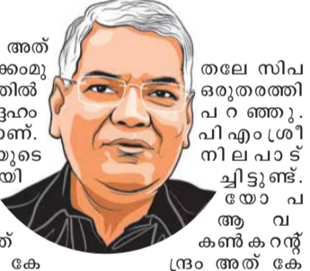
തലേ സിപിഐയുടെ പരാമർശം. പിഎംശ്രീ നിലപാട് ചൂണ്ടിയിട്ടുണ്ട്. ആയോധനം കർഷകർക്ക് നേരിട്ടുവരികെ.

കരിക്കാനും കേന്ദ്രീയവൽക്കരിക്കാനുമാണ് അത് പ്രോത്സാഹിപ്പിക്കുന്നതെന്നതിനാൽ തുടക്കമുണ്ടാകാൻ കഴിയില്ലെന്ന് എൻഇപി വിദ്യാർത്ഥികൾക്ക് വിട്ടുവീഴ്ചയ്ക്കില്ലെന്ന് ഡി. രാജു.