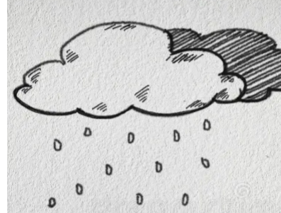
സാധ്യത. തിങ്കളാഴ്ച ഒറ്റപ്പെട്ട അതിശക്തമായ മഴയ്ക്കും ഒക്ടോബർ 27, 28 തീയതികളിൽ ഒറ്റപ്പെട്ട ശക്തമായ മഴയ്ക്കും സാധ്യതയുണ്ടെന്നും കേന്ദ്ര കാലാവസ്ഥ വകുപ്പ് അറിയിച്ചു.

ന്യൂഡൽഹി: ബംഗാൾ ഉൾക്കടലിൽ 'മോൻതാ' ചുഴലിക്കാറ്റ് രൂപപ്പെട്ടു. അതിനിടയിൽ തുടങ്ങി. ഇന്നലെ അർദ്ധരാത്രിയിൽ തുടങ്ങി. ഇന്നലെ അർദ്ധരാത്രിയിൽ തുടങ്ങി.